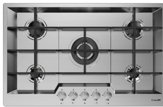
Table de cuisson KE 7602 032