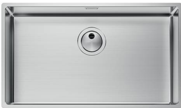
Évier S4001 3138 850