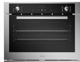
Four KE 75 7137 000