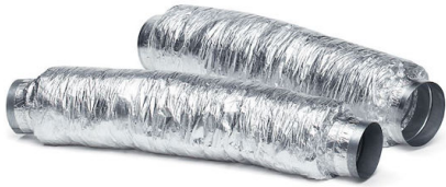
Gaine flexible silencieuse Ø 120 9700 602